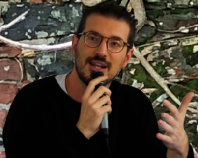
STOP ARMING ISRAËL FRANCE