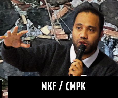
MKF / CMPK