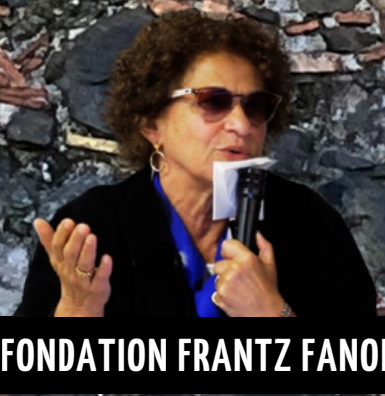
FONDATION FRANTZ FANON